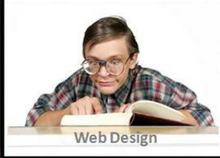
come mi vedono i miei genitori