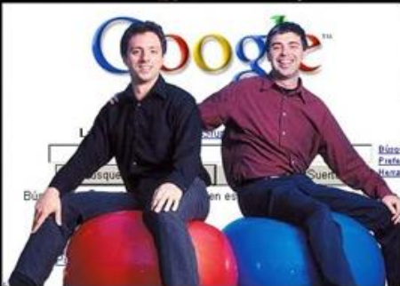
come mi vedono i miei amici