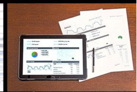
cosa faccio realmente = aiuto i business a crescere online