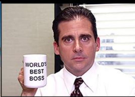
come mi vedo io