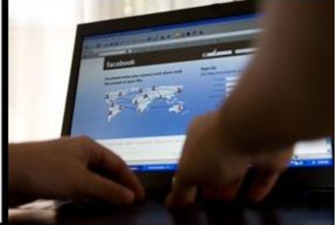
come mi vedono i miei clienti