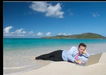
come mi vedono tutti gli altri